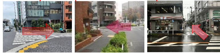
【II】DUCATIを越えて見える横断歩道を渡って右折