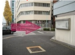
【II】DUCATIを越えて見える横断歩道を渡って右折