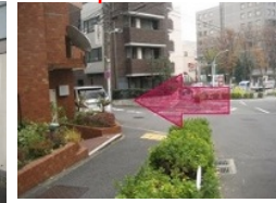
【III】1つ目の丁字路の茶色いビルを左折