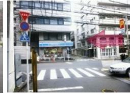
【IV】信号渡ってローソンを左にして直進