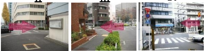
DUCATIを越えて見える横断歩道を渡って右折 1つ目の丁字路の茶色いビルを左折 信号渡ってローソンを左にして直進

JR渋谷駅より都バス「日赤医療センター前」行きに乗車。3つ目の停留所(国学院大学前)下車。30秒引き返すように進むと、左側に実践女子学園中学校高等学校の「正門」があります。